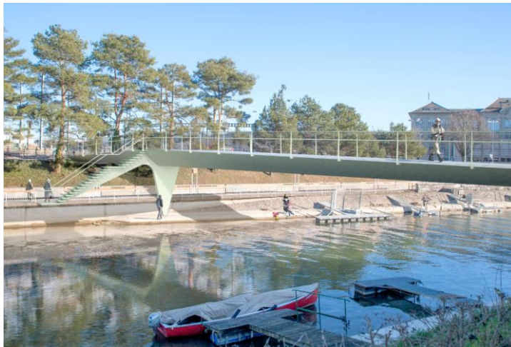
Passerelle des Cigarières – image de synthèse - Brauen Wälchli Architectes

Le projet a reçu l'approbation de l'Etat, les travaux sont prévus au deuxième semestre 2024.